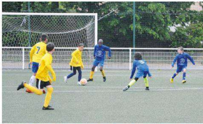
Une journée de tests s'est déroulée le 8 mai dernier au parc des sports du Grand pré.

Des élèves du collège effectueront, en plus de leurs cours habituels, trois heures de football chaque semaine, à partir de septembre prochain.