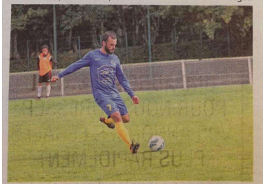
Promu en D1, Voisins-le-Bretonneux marche sur l'eau en ce début de saison.